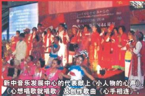
新中音乐发展中心的代表献上《小人物的心声》、《心想唱歌就唱歌》及创作歌曲《心手相连》。