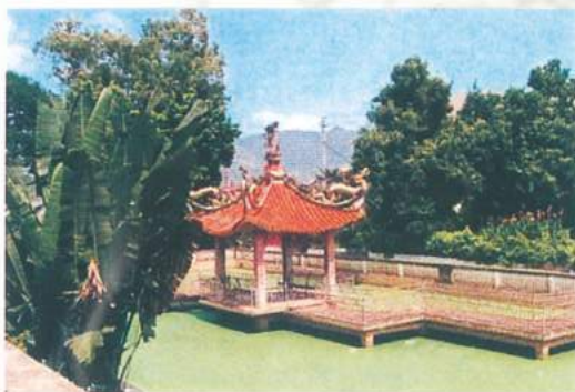
今天诗山公园一角

山文化站。原本的诗山公园阅兵广场则改建为运动场和园内通道。东边仰高亭前耸立的诗山革命纪念碑乃建于1964年，碑高4.8米，占地48平方米，已列