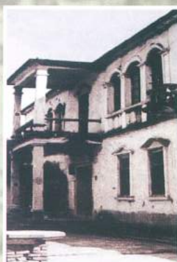
诗山图书馆旧照(现改建为诗山镇老年人活动中心)