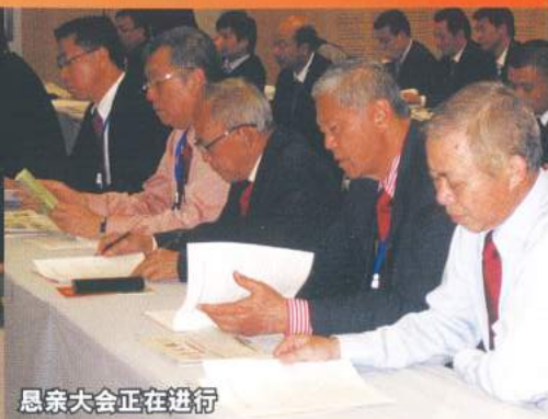
恳亲大会正在进行

一个题为‘乡情满狮城闽风载四海’的第七届世界福建同乡恳亲大会将在2012年于新加坡举行。这个消息公布自于5月23-25日，在南非开普敦举行的第六届世界福建同乡恳亲大会。