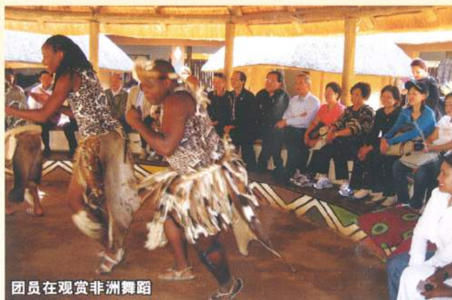
团员在观赏非洲舞蹈