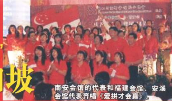
南安会馆的代表和福建会馆、安溪会馆代表齐唱《爱拼才会赢》。

八月一日在珍珠坊大厅举行的第三届‘爱国歌曲大家唱’活动中，十六个宗乡会馆及华族社团、学校的近三百位表演者，在主宾人力部颜金勇部长莅临，集体合唱国歌和念誓约之后，唱起了一首又一首的爱国、怀旧歌曲。