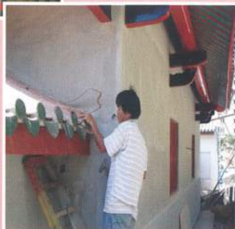
工匠正在砌上绿色滴水沟，以保有原貌、原色的滴水沟。

2005年的一次会馆执监委会议上，出席会议的理事议决重修具173年历史的古刹，遂成立新加坡凤山寺国家古迹重修委员会，以积极筹备重修工程、筹募重修基金及策划一切事宜。