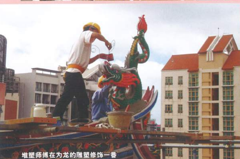
堆塑师傅在为龙的雕塑修饰一番