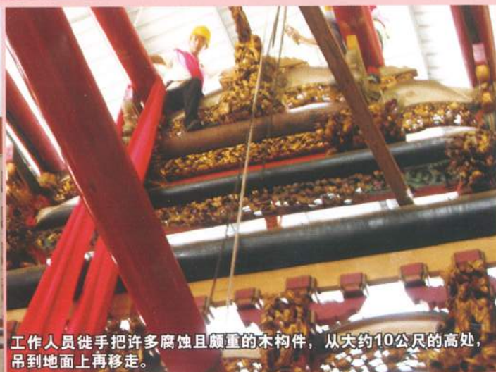
工作人员徒手把许多腐蚀且颇重的木构件，从大约10公尺的高处，吊到地面上再移走。