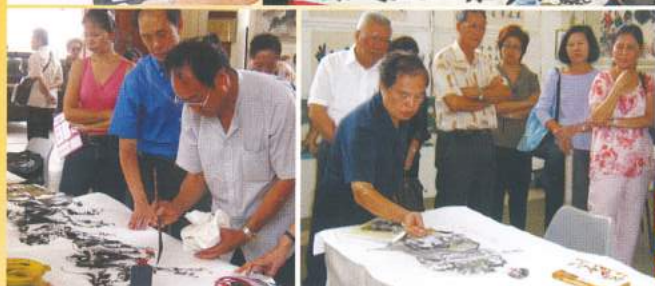
参与交流的书画家正聚精会神地在作画、挥毫。