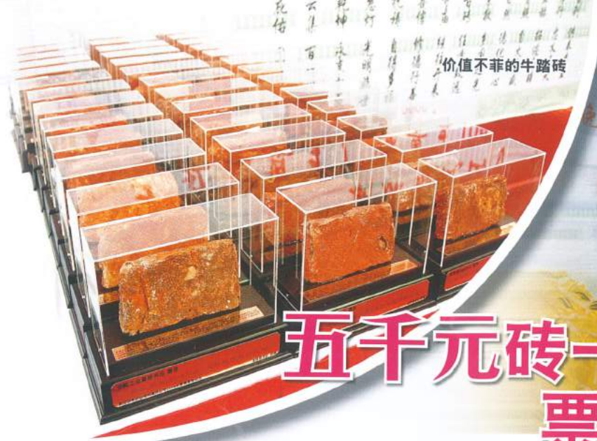
价值不菲的牛踏砖