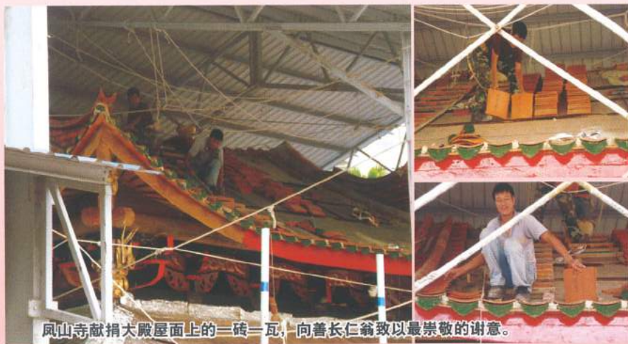
凤山寺献捐大殿屋面上的一砖一瓦，向善长仁翁致以最崇敬的谢意。

南安会馆也已暂订明年10月上旬为古迹的重修竣工，举行隆重的落成典礼。届时凤山寺将以崭新的面貌迎接广泽尊王和所有出席观礼的乡亲、朋友和嘉宾们。