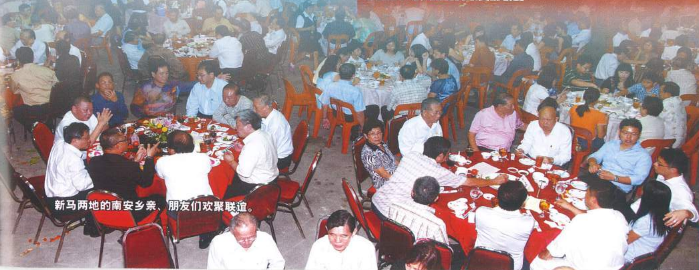
新马两地的南安乡亲、朋友们欢聚联谊。