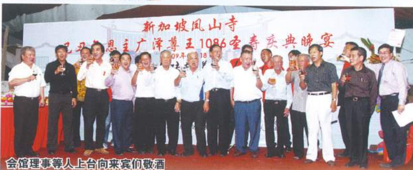
会馆理事等人上台向来宾们敬酒

在他亲自推介下，出席盛宴的南安乡亲及公众热烈响应，纷纷购票。广泽尊王千秋盛宴终在热闹、欢愉的气氛下划上句点。