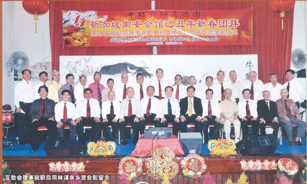
互助会理事就职后同林谋泉乡贤合影留念