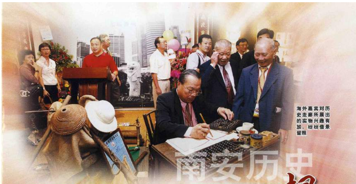
海外嘉宾对历史走廊所展出的实物兴趣有加，纷纷借景留照