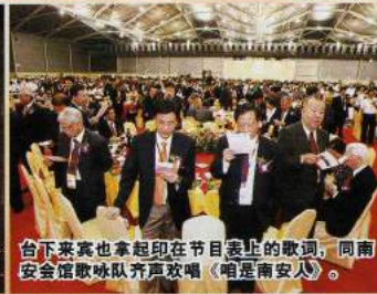
台下来宾也拿起印在节目表上的歌词，同南安会馆歌咏队齐声欢唱《咱是南安人》。