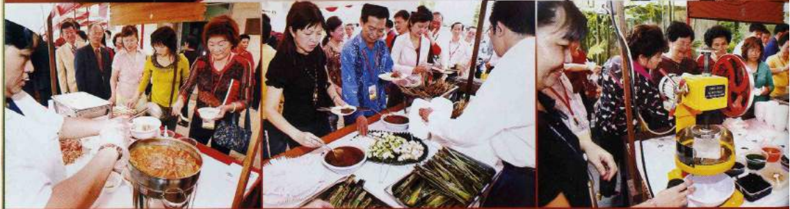
南洋风味美食如叻沙、沙爹及Ice Kachang对海外嘉宾深具吸引力