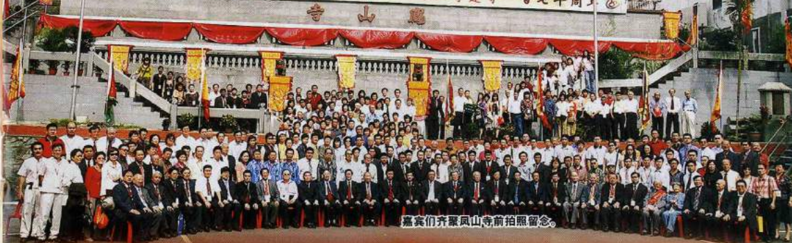
嘉宾们齐聚凤山寺前拍照留念。