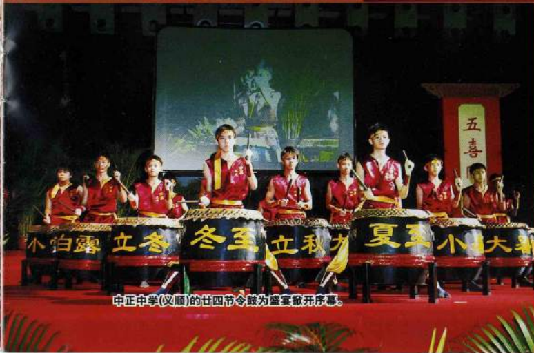
中正中學(文順)的廿四節令鼓為盛會掀開序幕。