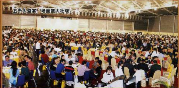
五千入盛會，場面盛大壯觀。