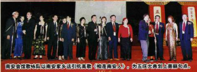
南安会馆歌咏队以南安家乡话引吭高歌《咱是南安人》，为五庆大典划上美丽句点。