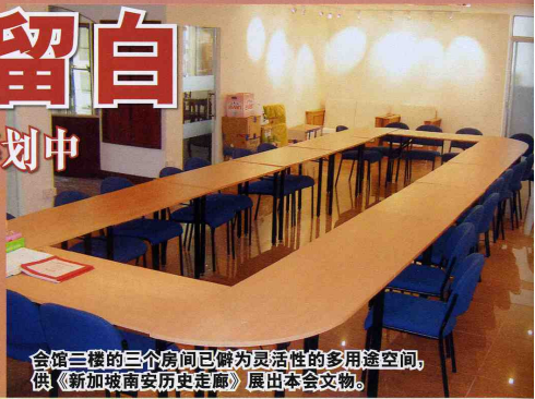
会馆二楼的三个房间已僻为灵活性的多用途空间，供《新加坡南安历史走廊》展出本会文物。